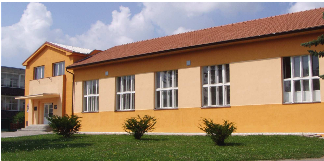
Běrunická sokolovna byla po rekonstrukci znovu slavnostně otevřena na posvícení 9. září 2006.