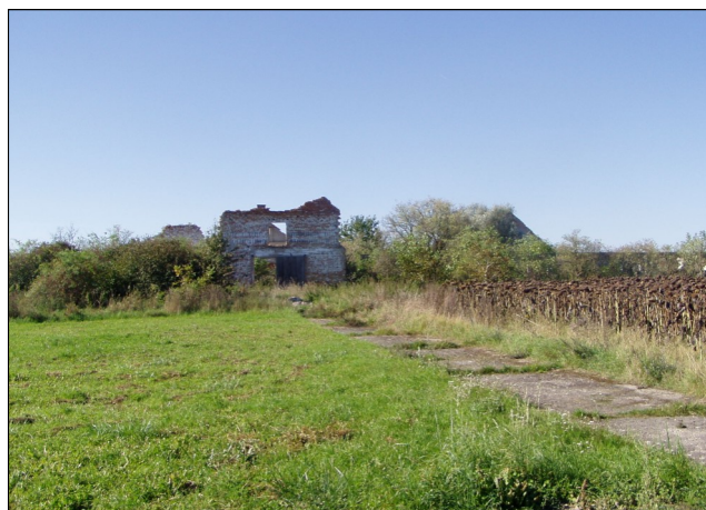
Starý a nový kravín včera a dnes....